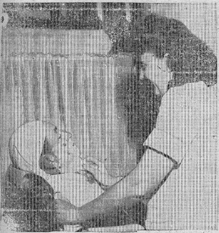
BARBERA —Debido a que su esposo está combatiendo por la patria (Israel), esta señora de la ciudad de Haifa lo reemplaza en la barbería y aquí se le ve afeitando a un cliente.

SIRVIENTA DE ADENTRO Se necesita, con botafueros de zardra. En esta oficina informen.